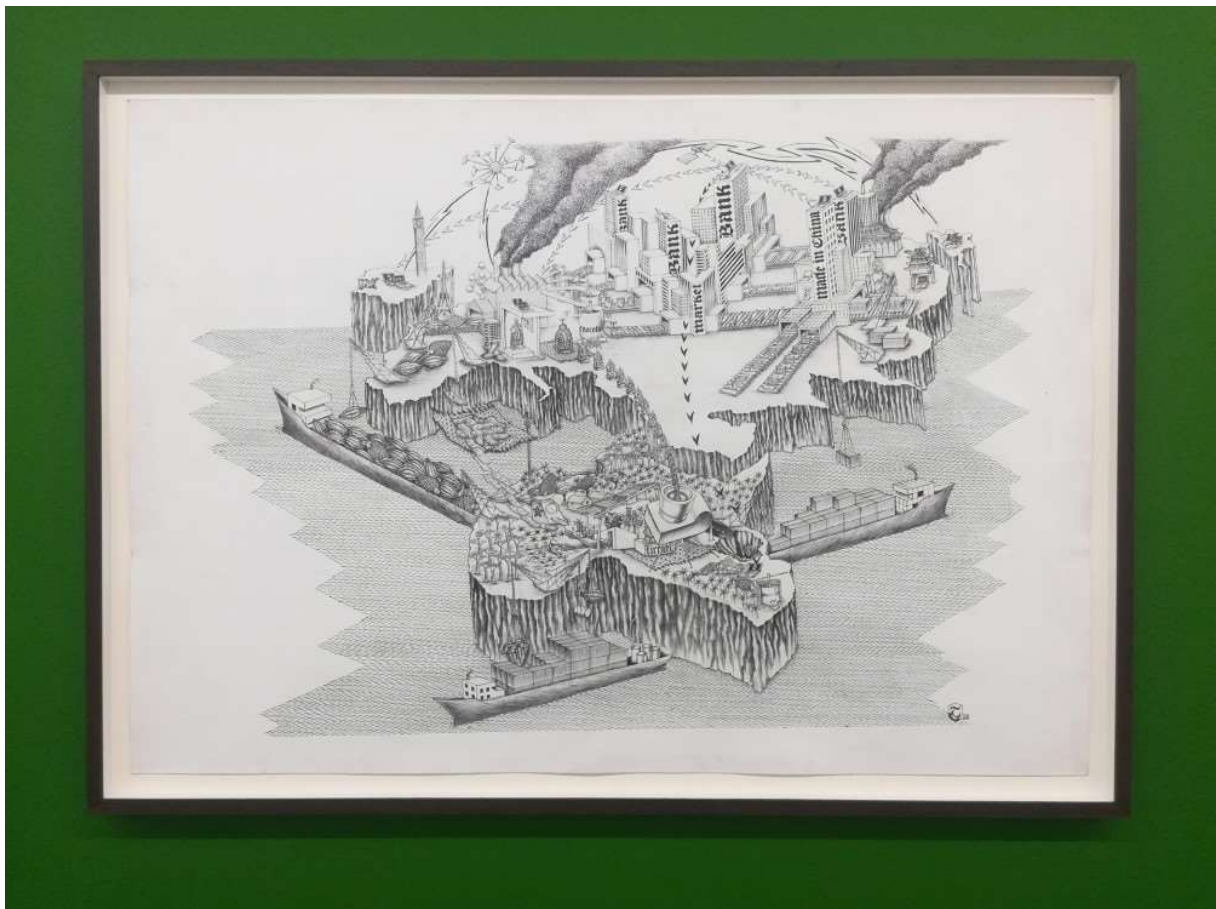
CATPC, Untitled , 2018. Courtesy of the artist and Galerie Fons Welters