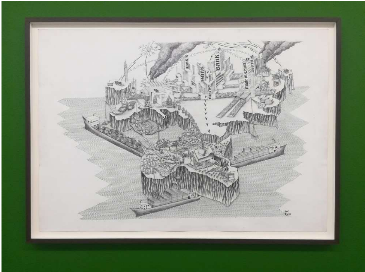
CATPC, Untitled , 2018.